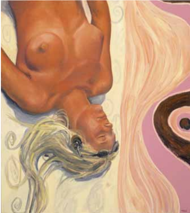
Pin-up No. 59, 2002 Olja på duk, 141 x 126 cm