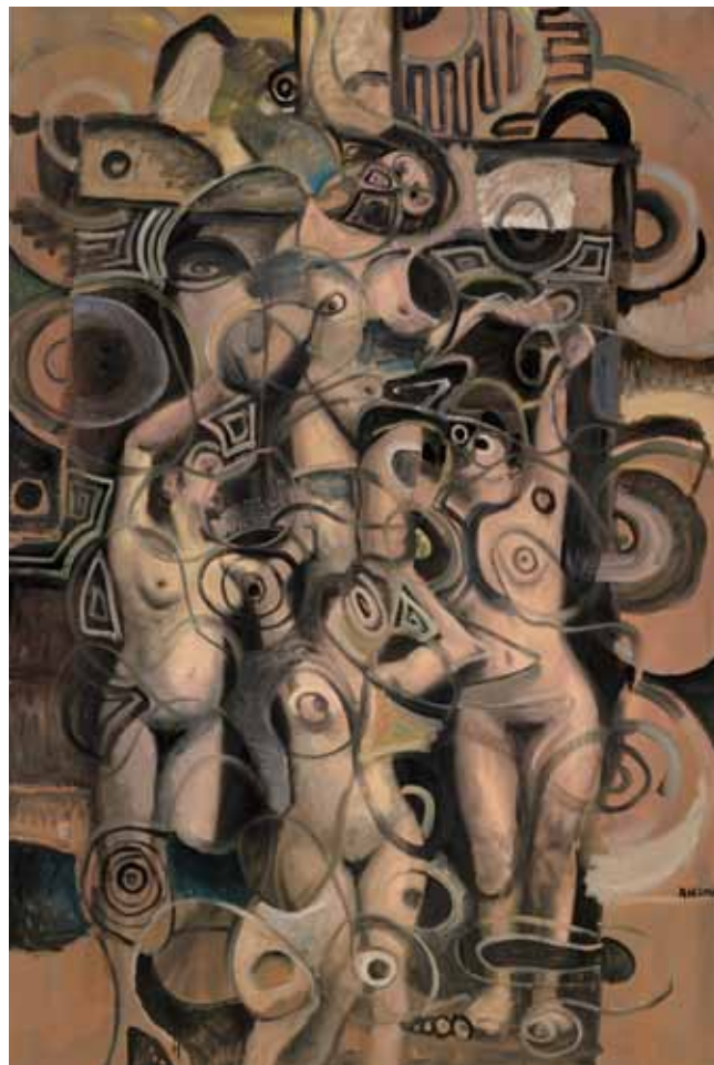
Komposition mit Pin-ups No. 1, 2011 Olja på duk, 181 x 120,2 cm

Henning målar sina Pin-ups i olika grader av abstrakt och figurativt. Pin-ups från 2012, som visas på nedre plan, gestaltas mer expressivt och våldsamt, på ett sätt som för tanken till Francis Bacons målningar.