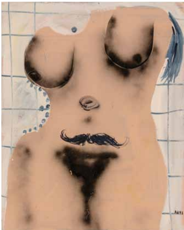
Untitled , 1991 Olja på duk, 102,3 x 81,5 cm