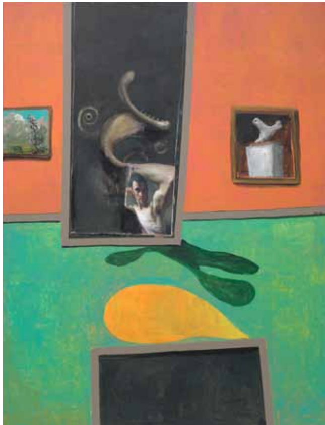
Manker 21.06.2010 II, 2010

Akryl och fotografi på duk, 267 x 204 cm Courtesy Collection Bastian